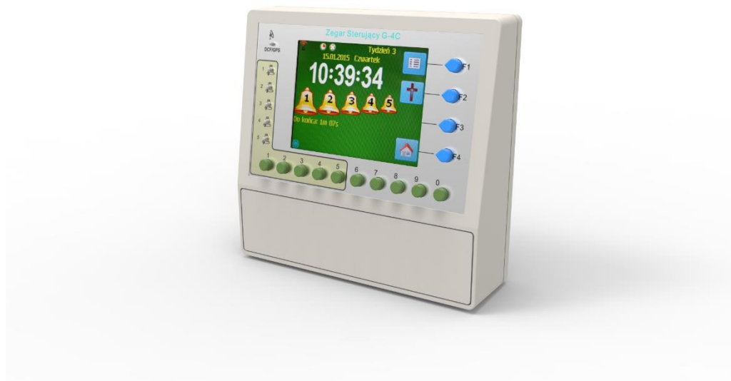
Zegar sterujący UNI-BELL – ekran dotykowy 5,7” z przyciskami